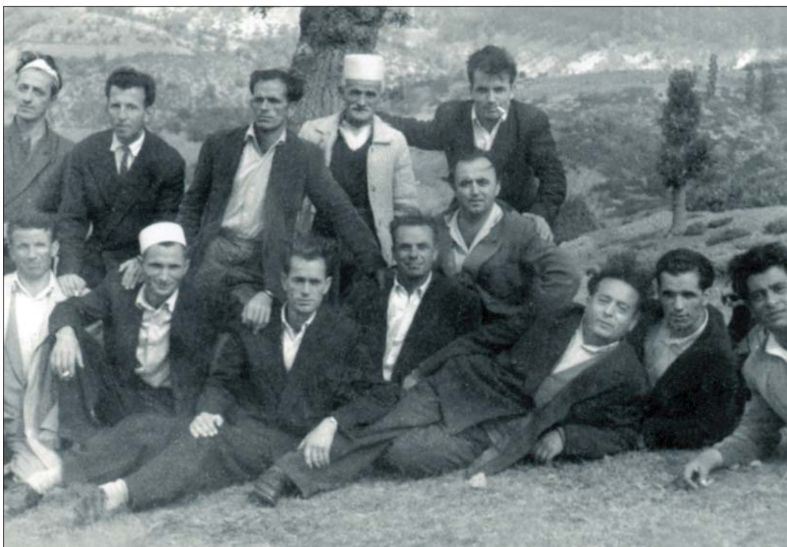
Në këtë foto të rrallë të vitit 1970 gjeni veten dhe të afërmit tuaj