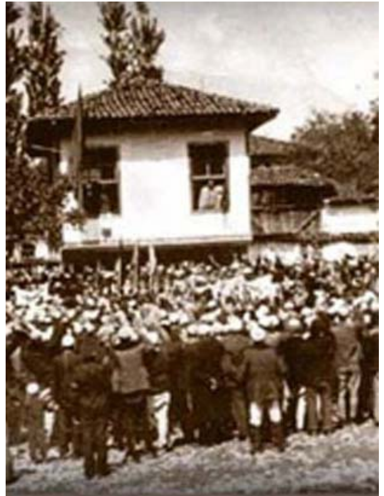
(Biçakun) dhe nëpërmjet tij me Ismail Qemal Vlorën.